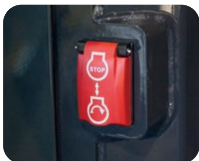
Interrupteur d'arrêt secondaire du moteur