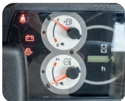
Voyant de la ceinture de sécurité sur le tableau de bord