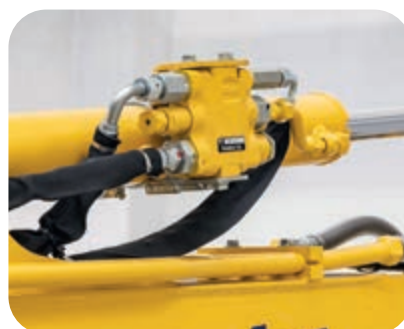
Clapets de sécurité sur vérins de flèche et de balancier